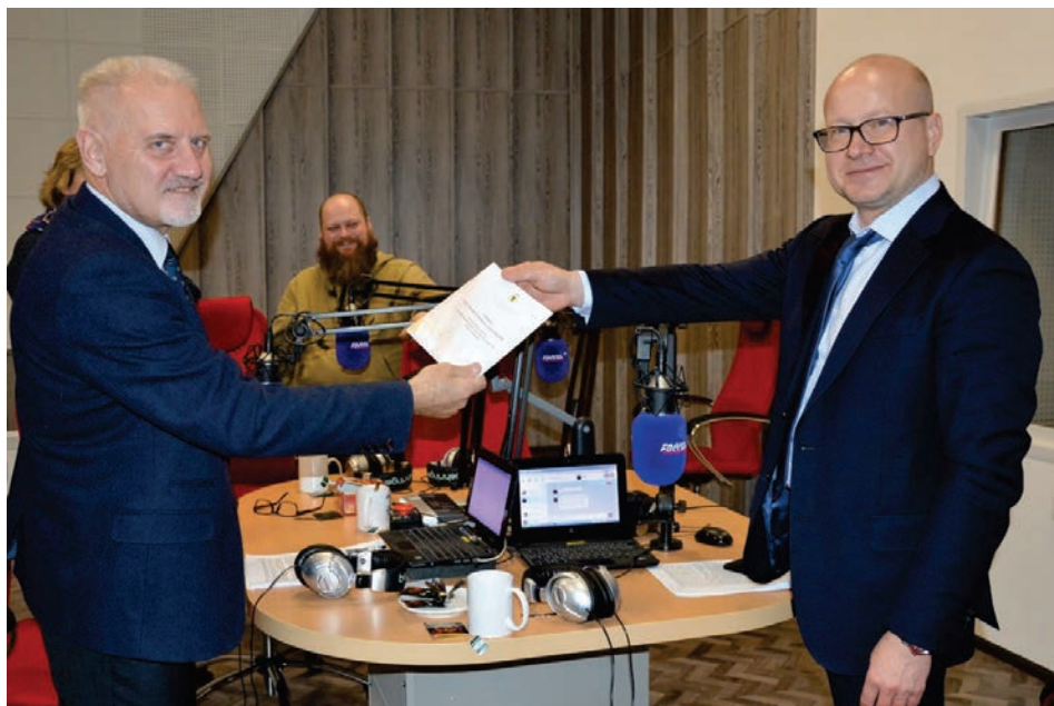
Первый радиозфир в 2019 году

Первый в этом году эфир авторской программы регионального Уполномоченного на «Радио России – Ярославль» «Имеем право!» был посвящен вопросам реализации прав жителей региона на доступ к объектам культурного наследия, их сохранению и возрождению.