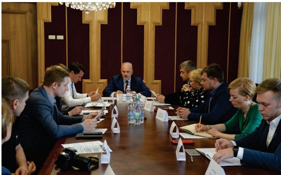
Круглый стол по вопросам защиты прав участников дорожного движения

В 2018 году стартовал информационно-просветительский проект Уполномоченного по правам человека в Ярославской области «ПРАВпросвет».